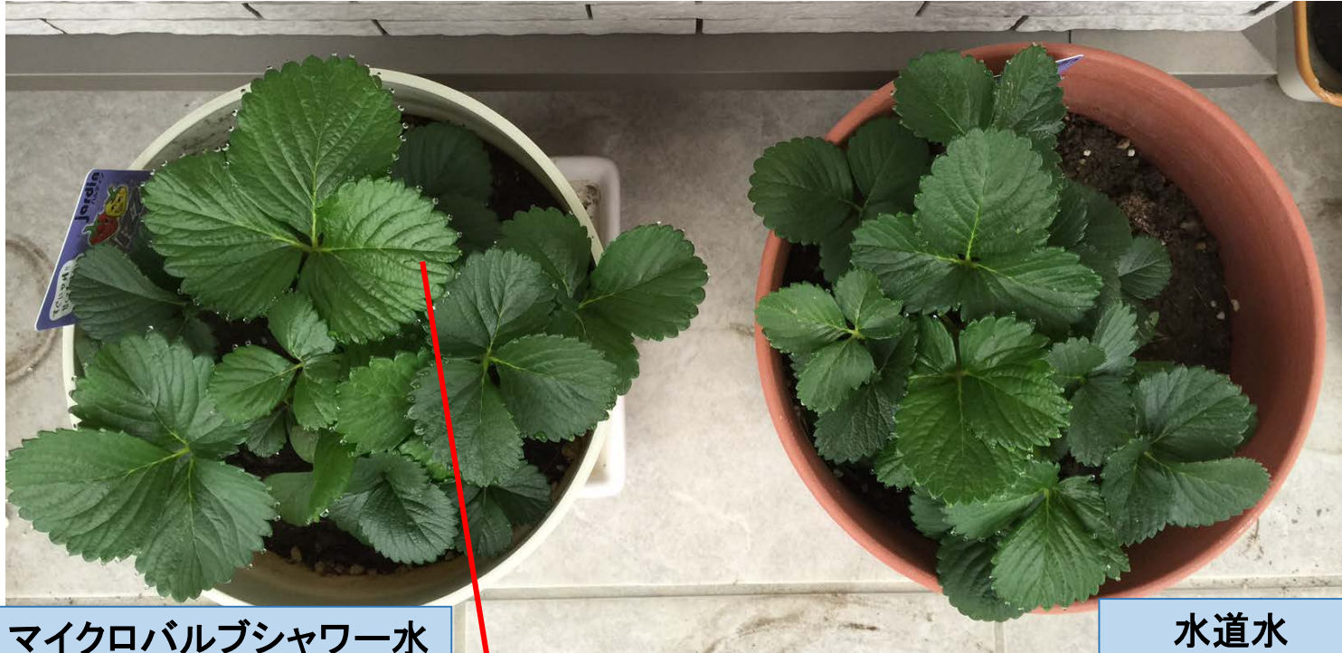
マイクロバブルシャワー水